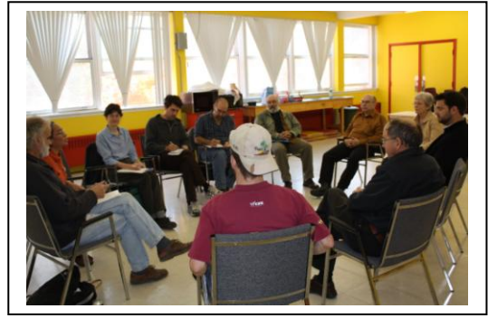
Assemblée citoyenne du 18 octobre 2009

Soulignons ici, en passant, les racines grecques du mot «démocratie» : dêmos = Peuple, kratos = puissance, souveraineté. Où en sommes-nous avec les fondements de cette définition? Il faut dire que par le temps qui courent, il est d'une grande importance de se poser la question. Non seulement au niveau municipal mais aussi national (et je ne parle pas du Canada), et même à l'intérieur de notre parti qui se réclame «d'une politique autrement». Je crois qu'il faut toujours se poser cette question, c'est absolument nécessaire. Sans cela les structures risquent de se «gangrener». Et c'est cela qu'on constate actuellement avec la démonstration dramatique de ce qui arrive au palier municipal. Toutefois, il semble (euphémisme poli)